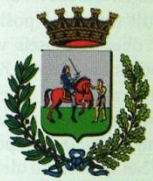
Piove di Sacco comune.piovedisacco.pd.it