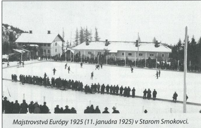
Majstrovstvá Európy 1925 (11. januára 1925) v Starom Smokovci.

Tatranskí hokejisti ani v nasledujúcich sezónach nedosiahli v rámci Slovenska výraznejšie úspechy. V rámci majstrovstiev nikdy neprešli cez župné majstrovstvá. Najskôr bol nad ich sily Prešov, neskôr sused z Popradu. Jediný výraznejší úspech zaznamenali hokejisti ŠKVT na národnom turnaji, dnes označovanom ako 8. Tatranský pohár, na prelome rokov 1934 a 1935. Tento turnaj hokejisti ŠKVT vyhrali, keď postupne zdolali Ligu Kežmarok 4:0, Nitru 3:0, Žilinu 4:1, VŠ Bratislava 3:0 a vo finále aj Skiklub Bratislava 5:2. ŠKVT tak samostatne prvý a jedinýkrát získal Pohár Palace sanatoria. Vysoké Tatry však natervalo zostanú zapísané nielen ako kolíska turnaja o Tatranský pohár (pôvodne Pohár Palace sanatoria Dr. Szontágha), ale i ako miesto, kde vznikla prvá organizácia zastrešujúca slovenský hokej a tu tiež došlo k dohode o organizovaní pravidelnej majstrovskej súťaže – najskôr v podobe jednorázových majstrovstiev, avšak už onedlho sa majstrovstvá hrali ako „dlhodobá súťaž“. ŠKVT a ním organizované turnaje mali pozitívny